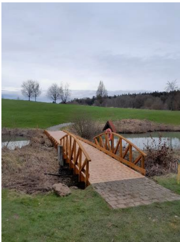
Brücke an der 11 mit den ersten neuen Bohlen

Im Rahmen der Winterarbeiten haben unsere Greenkeeper die Brücke an der Bahn 11 restauriert. Die alten und rutschigen Bohlen wurden ersetzt, der Unterbau wurde erneuert und das Gelände gereinigt.