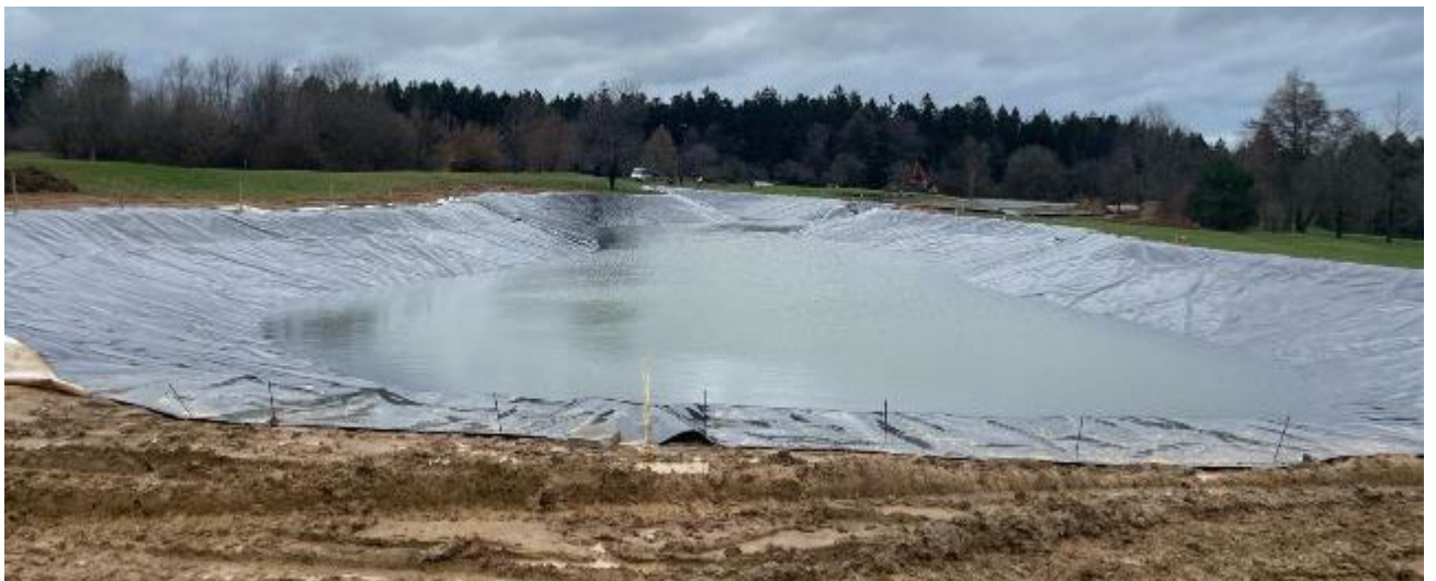
See füllt sich langsam