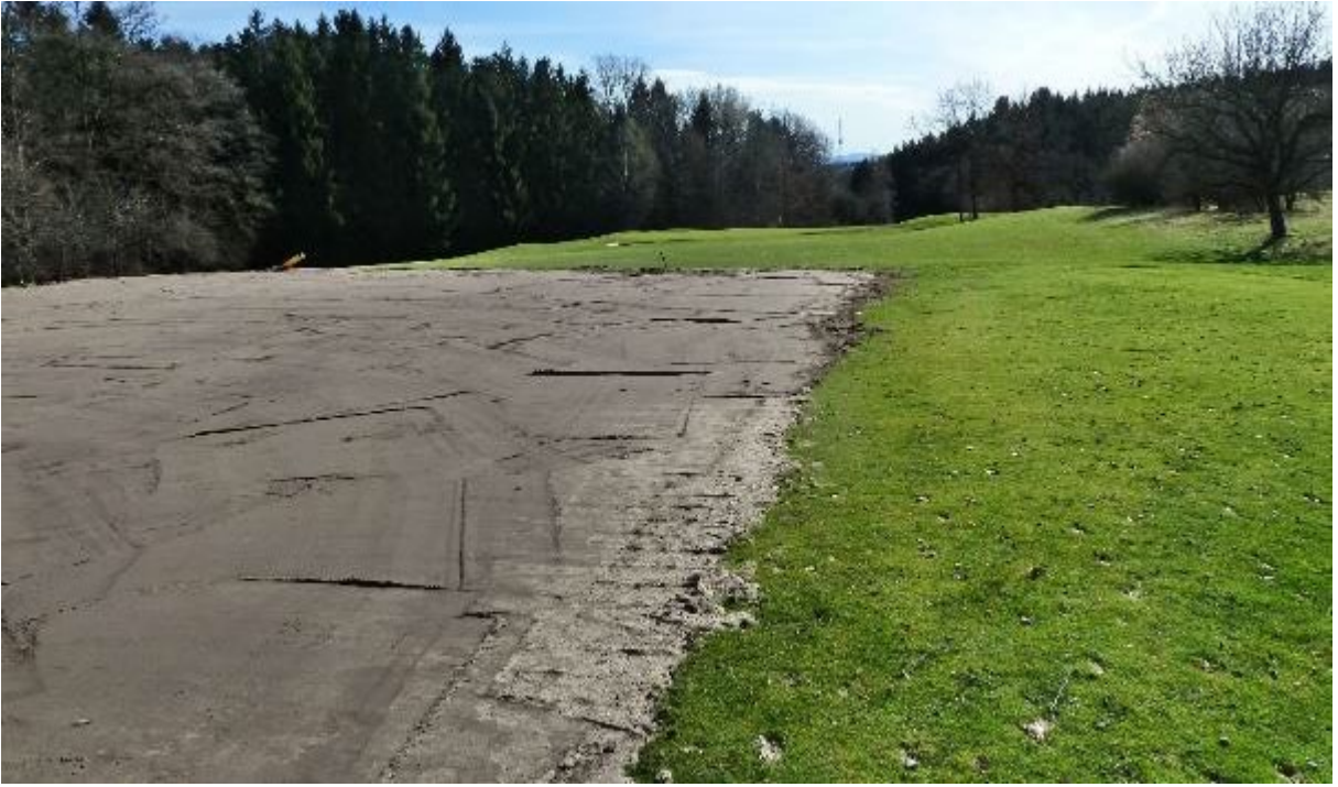
Deutlich vergrößerter 16er Abschlag macht bisherigen Ausweichabschlag links überflüssig