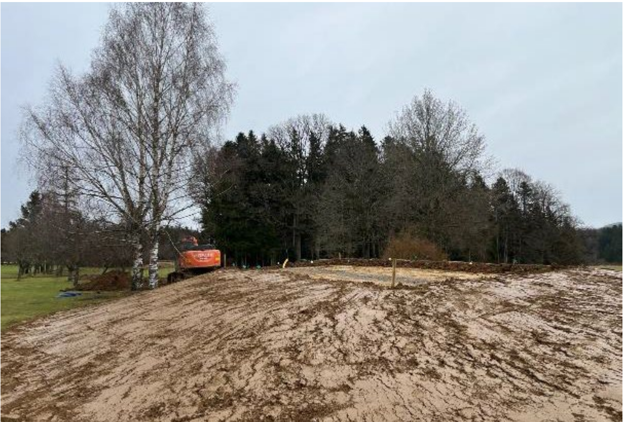
Fairway viel besser einsehbar durch neuen 2er Abschlag