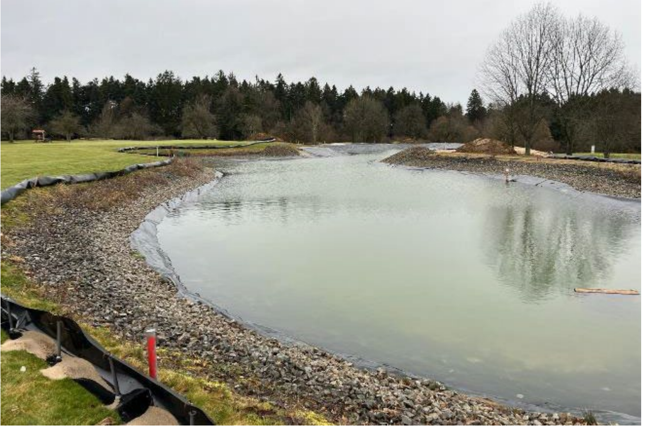
Bestehender See rechts, erweiterter Teil im Hintergrund