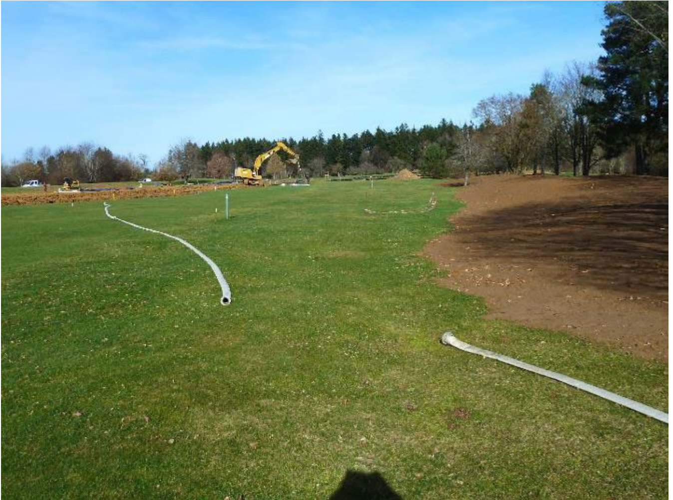
Rechte Seite der Bahn 4, bisher Semirough, künftig Fairway, mit Abgrenzung zur Bahn 3

Die Feinmodellierung des Aushubs zwischen den Bahnen 3 und 4 des Meisterschaftsplatzes ist fertiggestellt und bietet eine bessere Abtrennung der zwei Bahnen. Zudem schützt der Aushub die Wurzeln der Bäume, die dort teilweise bis an die Oberfläche ragten, und die Mähwerke unserer Semirough-Mäher.