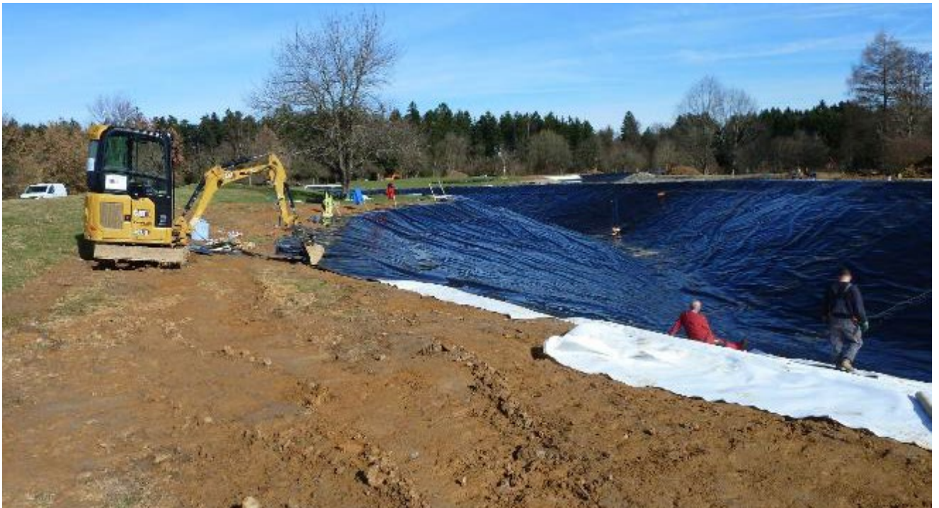
Folienverlegung am neuen See links

Unsere Seen auf den Bahnen 4, 5, 17 und 18 sind miteinander verbunden. Über Drainagen fließt das Oberflächenwasser in die Seen an der 17 und 18 und kann anschließend über eine Pumpleitung in die oberen Seen an der 4 und 5 hochgepumpt werden, von wo aus die Beregner an den Grüns und Abschlägen versorgt werden.