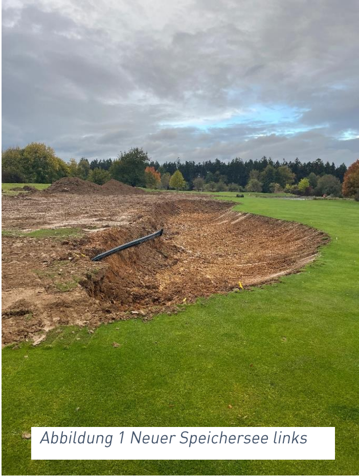
Abbildung 1 Neuer Speichersee links

Der Aushub der bislang durchgeführten Baggerarbeiten wurde auf den Kurzplatz gefahren, um dort das Gelände im Bereich der Bahnen 2, 5 und 6 zu modellieren.